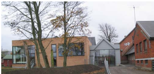
Facade mod Hvalsø Sø