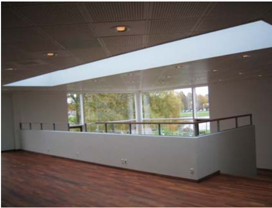
Bibliotek med indskudt etage