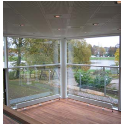
og stort udsigtsparti mod søen.