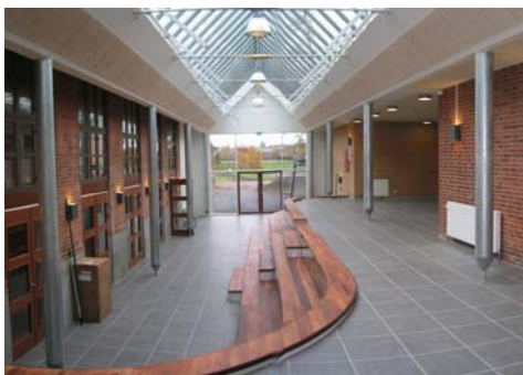
Kulturstræde set fra hovedindgang