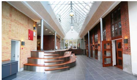
Glasoverdækket stræde med sidde trin.