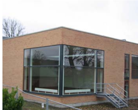
Facadeparti mod søen